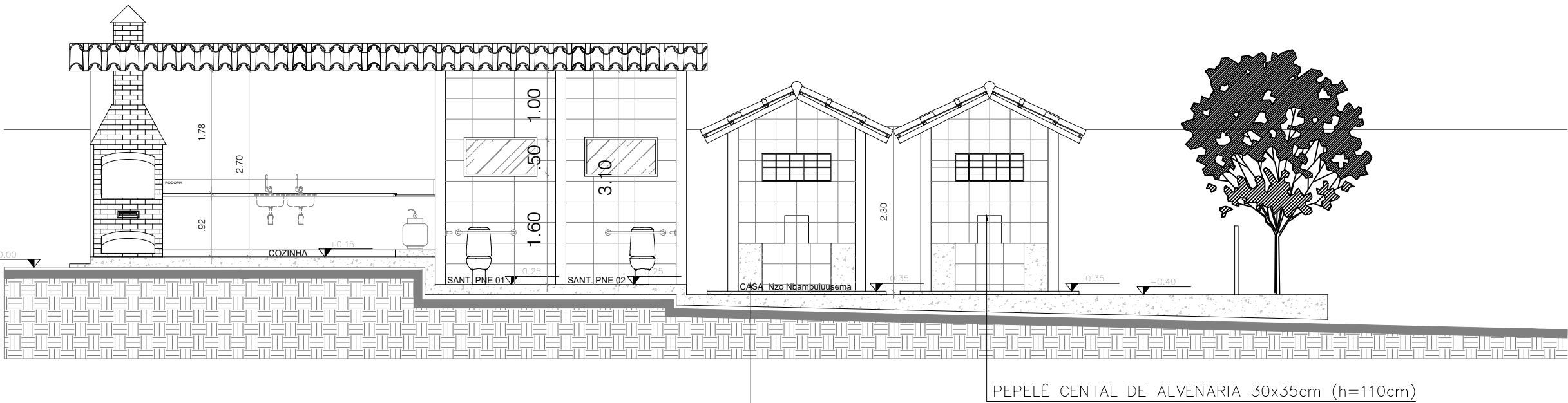
CORTE_E-E'_ÁREA EXTERNA ESCALA:1/100